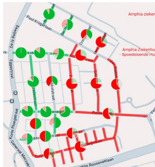
Resultaat per straat(deel), samen met de dominante voorkeur (indien aanwezig) per straat(deel).

Uit de opmerkingen blijkt ook dat veel bewoners zich zorgen maken over de verkeersveiligheid in de wijk. Regelmatig werden gevaarlijke situaties genoemd door (fout-) parkeren op hoeken, in bochten en (gedeeltelijk) op stoepen. Bewoners geven aan dat hierdoor het zicht vermindert, voetgangers worden gehinderd, en hulpdiensten mogelijk moeilijker doorgang vinden.