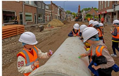
Jong geleerd oud gedaan. Leerlingen van groep 6 van de Zandberg bezoeken de werkzaamheden in de Generaal Maczekstraat en versieren een rioolbuis die daarna de grond ingaat.

We zoeken vrijwilligers om deze excursie te organiseren. Het gaat dan om het reserveren van de datum en de rondleiding, het contactadres zijn voor de aanmeldingen, en het organiseren van een gezellige nazit. Als dit u aanspreekt en u het ook fijn vindt om samen met wijkgenoten iets te ondernemen, meldt u dan aan bij https://www.wijkraadsportpark.nl