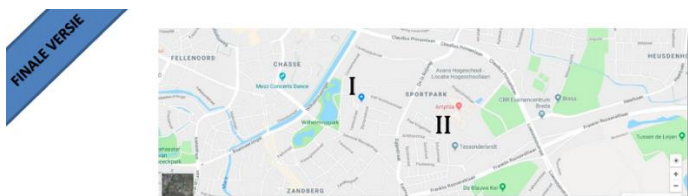
Rapport Schouw Sportpark II (2 okt. 2018) en Sportpark I (10 okt.) Datum: 20 maart 2019